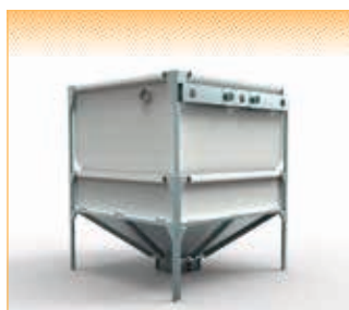
GEObox Speed - version pour sonde d'aspiration