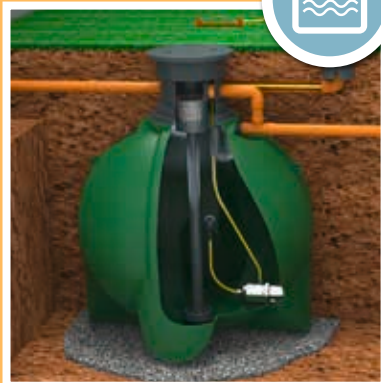
EAU DE PLUIE