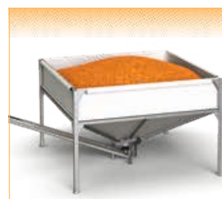
GEObox Bag G4 - version pour vis ascendante