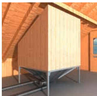
installation aux greniers