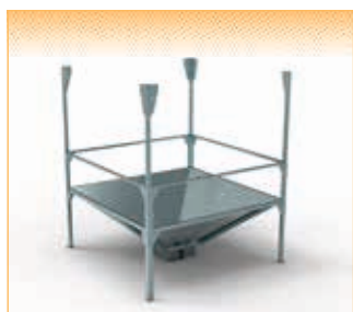
GEOflex - version pour système d'aspiration