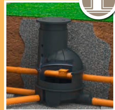
SYSTÈMES DE PUIES