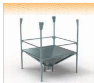
GEOflex G4 - version pour vis ascendante