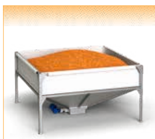
GEObox Bag - version pour système d'aspiration