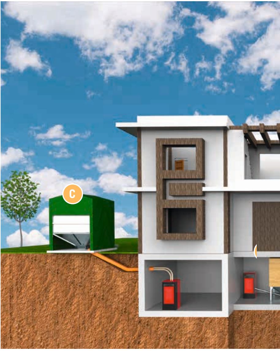
Stockage enterré GEOtank