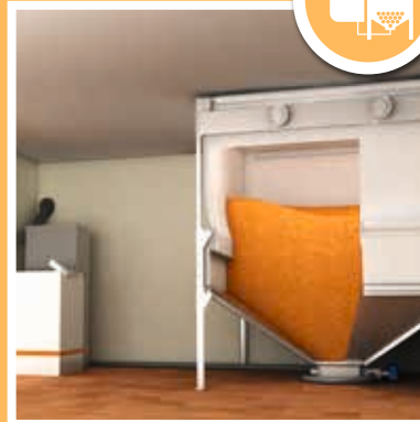
STOCKAGE POUR PELLETS