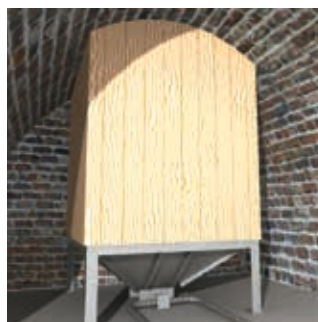
installation dans les caves voutées