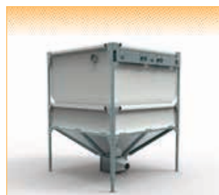
GEObox C - version pour vis directe