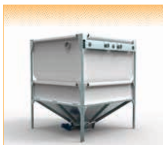
GEObox Speed - version pour système d'aspiration