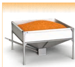
GEObox Bag C - version pour vis directe