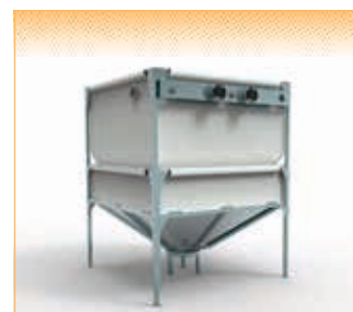
GEObox G4 - version pour vis ascendante