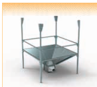
GEOflex C - version pour vis directe