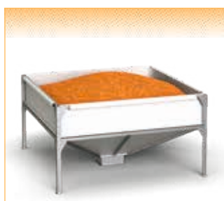
GEObox Bag - version pour sonde d'aspiration